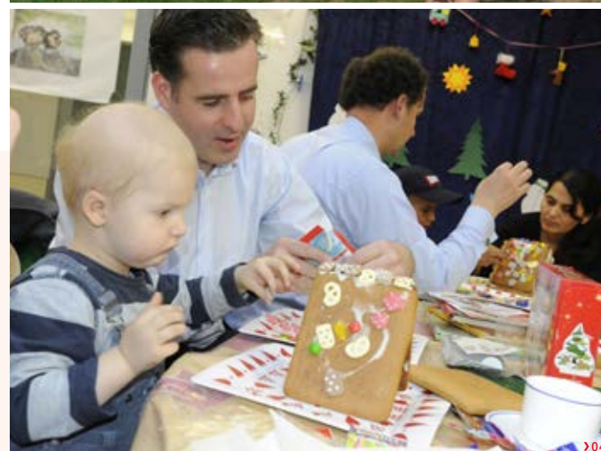
Ziel der Kinderkrebsstiftung ist es, die Lebensqualität der erkrankten Kinder zu verbessern.