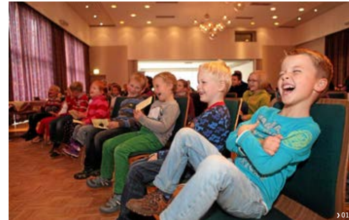
Wie bei der Märchenwoche gilt es, den Kindern die Behandlungszeit zu erleichtern.